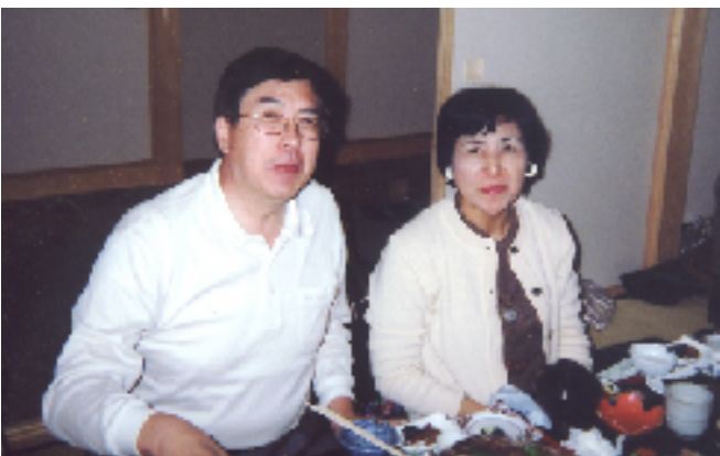
日本昭和村 「味彩館」にて