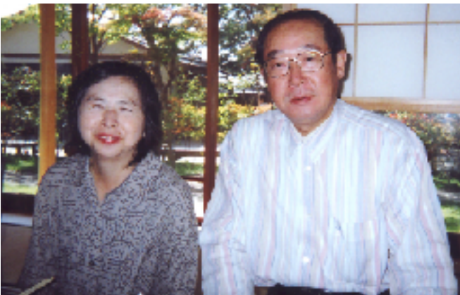
日本昭和村 「味彩館」にて