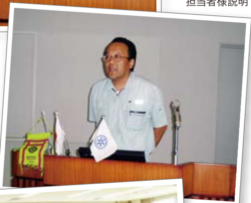
▼オーエスジー 担当者様説明