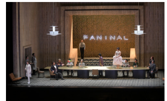
オペラ「ばらの騎士」