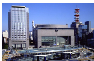
愛知芸術文化センター外観

最後になりましたが、劇場は、お客様に感動や夢、喜び、生きる希望を与える場です。ぜひ、劇場に足を運んでください。鍛えられたアーティストたちによる生の舞台は、テレビや録音とは異なる大きな感動を与えます。劇場は地域の魅力の一つです。劇場が愛知県民の誇りとなる存在となるため、ぜひとも応援をお願いします。また、将来のアーティストの育成のため、音楽家の卵である音楽学生の招待も継続していきたいと思っています。ぜひご支援をお願いします。どうもありがとうございました。