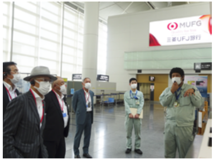
●Baggage Handling System / 旅客手荷物処理システム についての説明と視察の様子